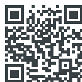
Горячая линия для противодействия коррупции